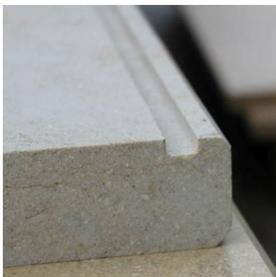
Водобран за шапки за стени

Грижа: препоръчваме импрегнирането на камък отвън, особено с антикирана повърхност, веднъж годишно. Препоръчваме използването на силиконов импрегнант.