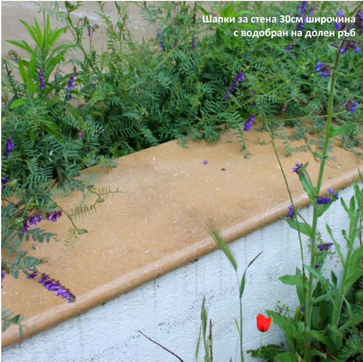
Шапки за стена 30см широчина с водобран на долен ръб