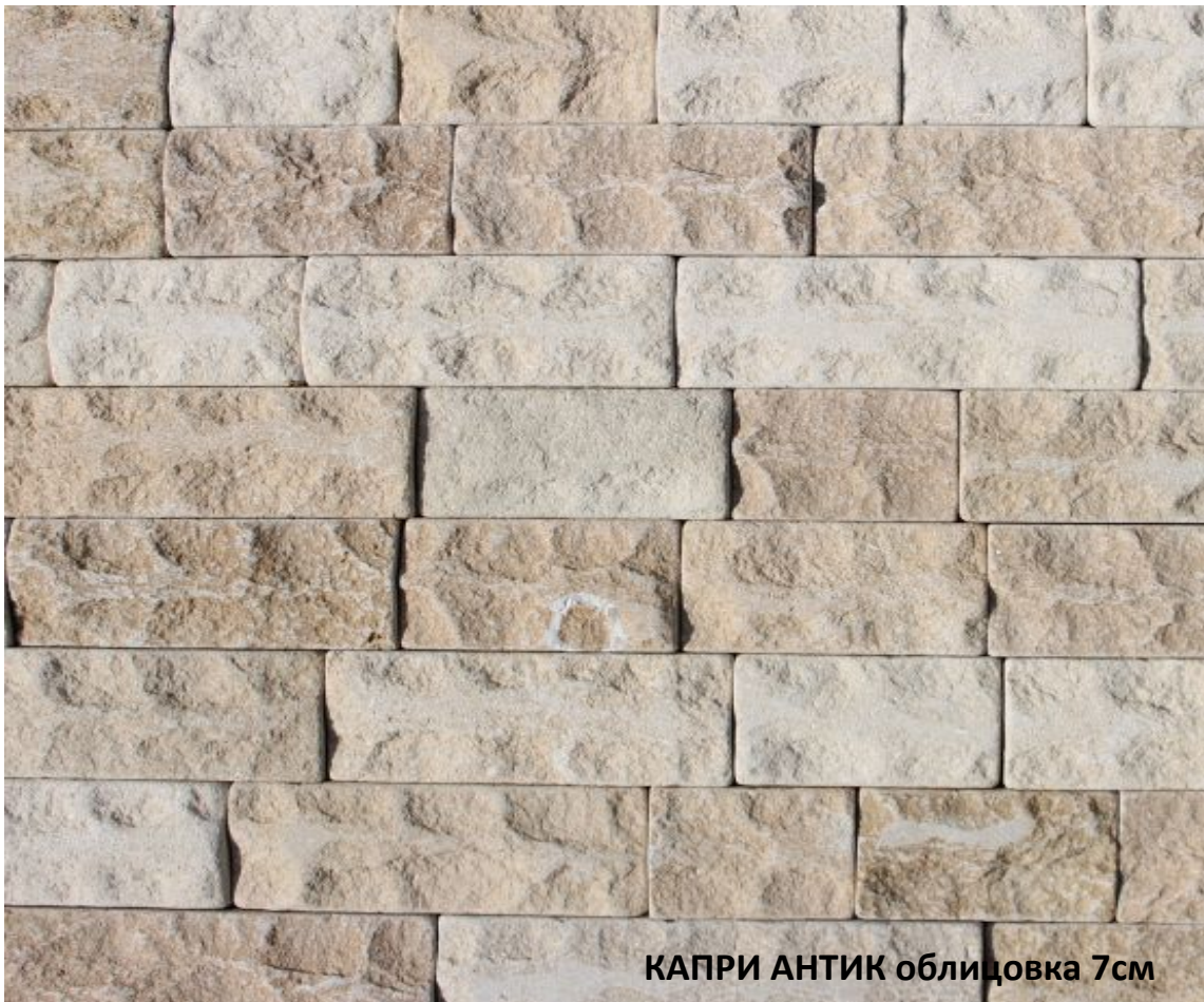
КАПРИ АНТИК облицовка 7см