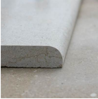
Четвърт 1/4R заобляне на преден ръб