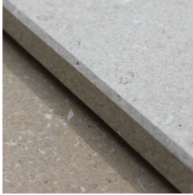
Фаска на преден ръб