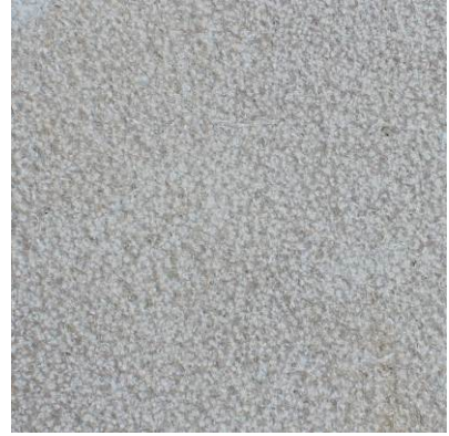
Стакато повърхност (bush hammered)