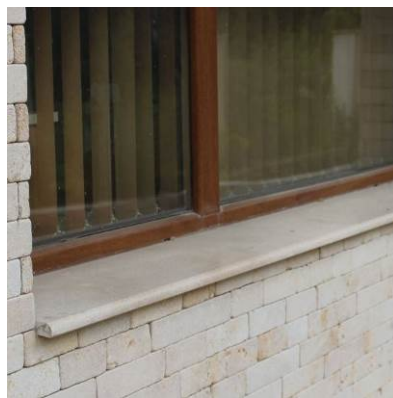
Камък с 1/4R заобляне и водобран