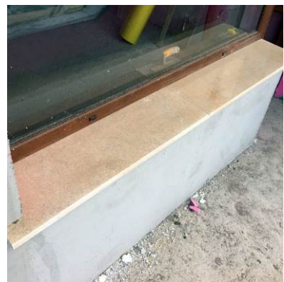
Външни подпрозоречни плочи с водобран