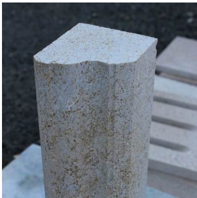
Суров масивен корниз от камък

Тегло: в зависимост от размера и дебелината