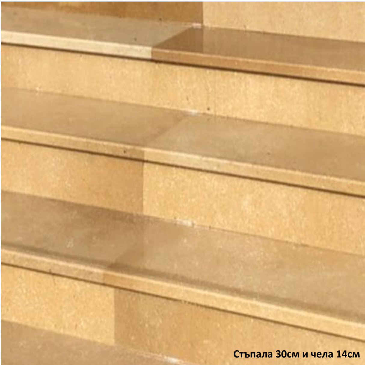
Стъпала 30см и чела 14см