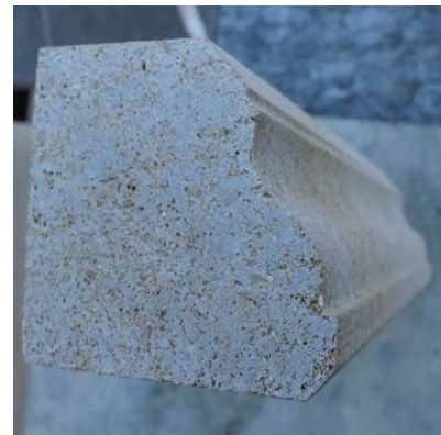
Страничен изглед на каменен корниз