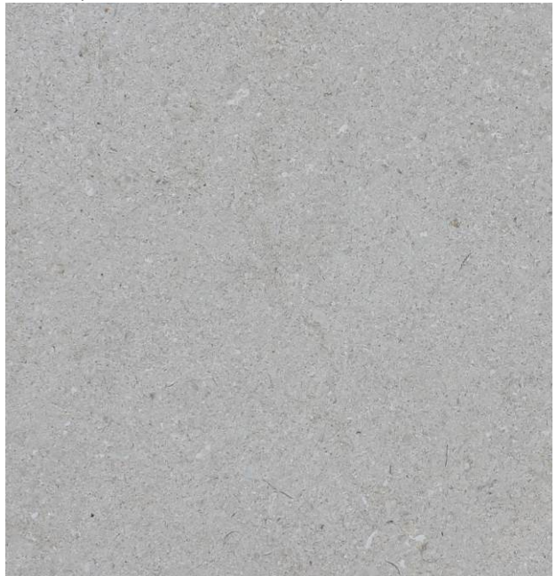
Антикирана повърхност (леко грапава)