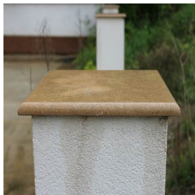
Шапка за колона с 4 страничен водобран