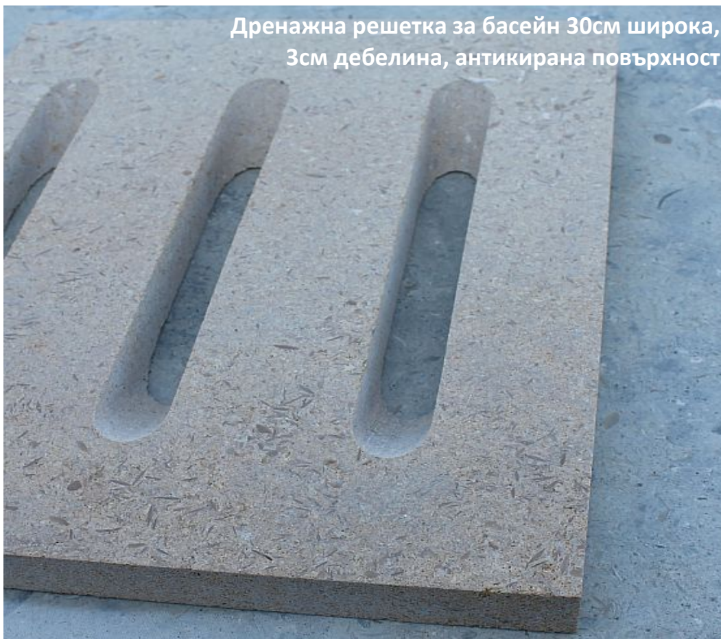
Дренажна решетка за басейн 30см широка, 3см дебелина, антикирана повърхност