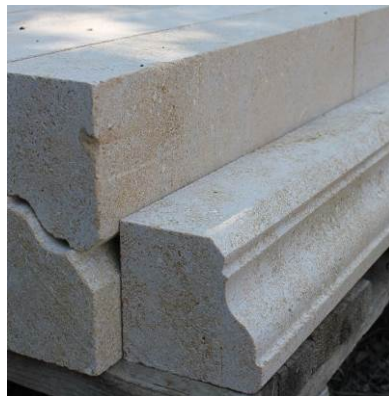
Антикиран корниз за камина