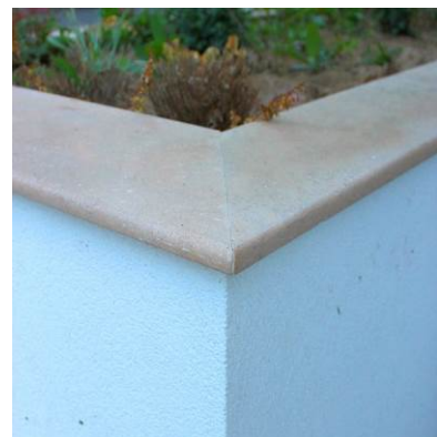
Капак за зид с рязане под 45 градуса