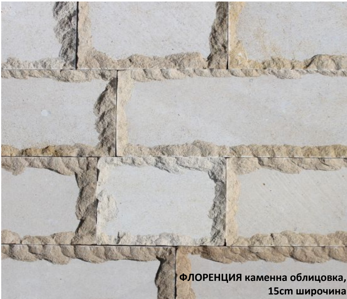
ФЛОРЕНЦИЯ каменна облицовка, 15см широчина