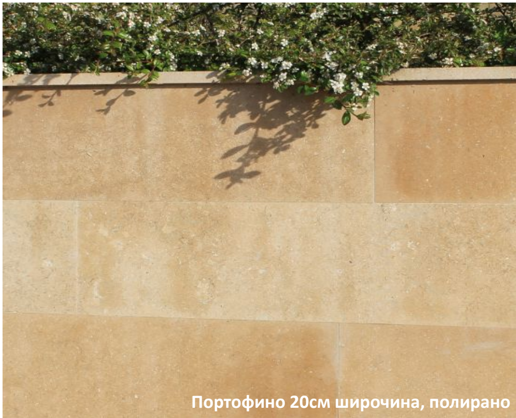
Портофино 20см широчина, полирано